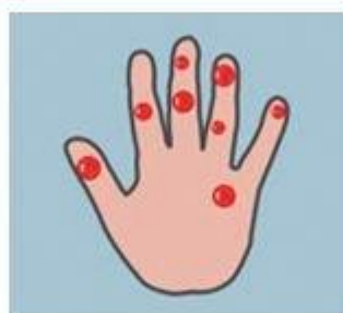
2-я степень обморожения

Потеря чувствительности пораженных участков Ощущение покалывания или пощипывания Побеление кожи