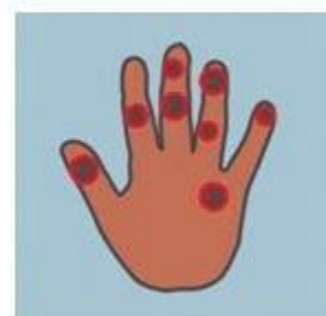
3-я степень обморожения

Волдыри (видно только после отогревания, возможно проявление через 6-12 ч)