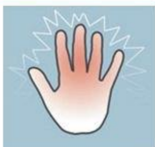
1-я степень обморожения

Потеря чувствительности пораженных участков Ощущение покалывания или пощипывания Побеление кожи